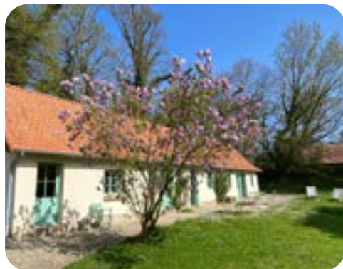
+32 473 70 59 36 info@lamaisonduvallon.fr