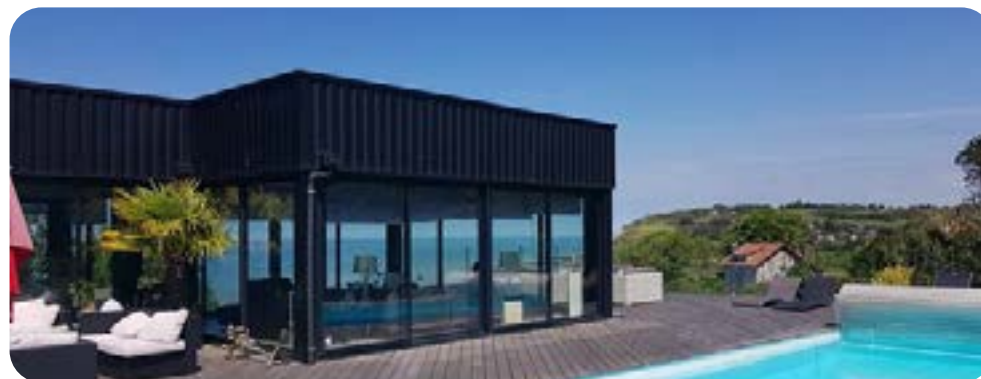
02 78 08 94 91 villa-quartz@pourville-sur-mer.com