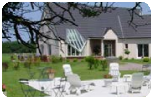
06 64 96 32 57 www.lesgrandesmesures.com