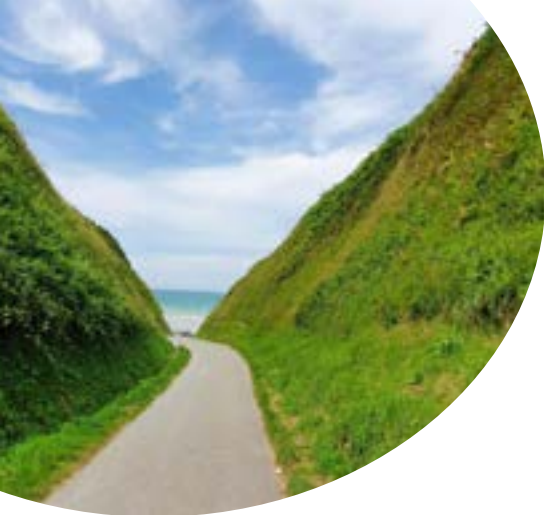
Christine Lefebvre 29 route de l'église Gîte - 6 personnes